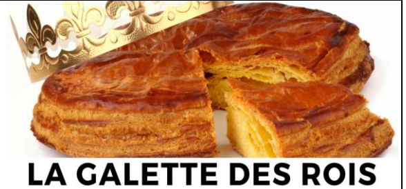
LA GALETTE DES ROIS

Galette Salle Léon Jouhaux Bourse du travail 67 rue Turbigo 75003 Paris Métro : Arts et métiers Bus 20, 38 et 47 Participation galette 5 € Tombola Panier garni : 2€ Nouvelle animation : "Chansons surprise". Inscription avant le 7 janvier Rolande Nault : 01 48 57 11 89 Nadia Chiappini : 06 62 84 94 63